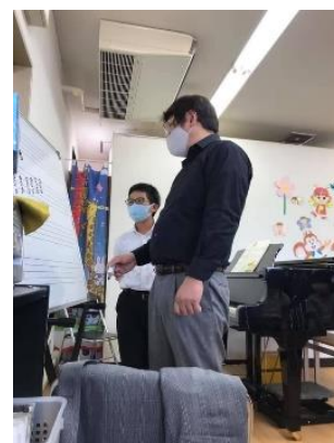
(昨年秋に広島で開催された公開レッスンより) 五線ボードに和音を書いて、和声の基本的な仕組みから表現方法を教えている様子

2020年はコロナ禍によって、オンラインでの講座を余儀なくされましたが、このことによって全国の様々なピアノの先生方に受講して頂き、今まで窺い知れなかった