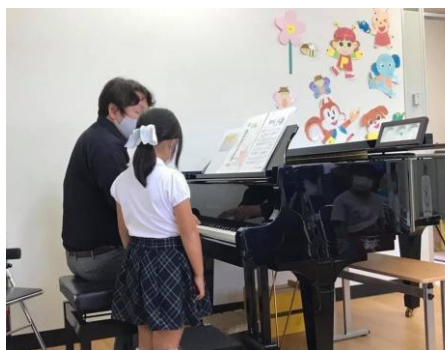
(同) 旋律や和音を弾いて、響きのイメージを言葉に置き換えさせている様子

私のフェイスブックアカウントでは講座の大まかな内容や様子を撮影した写真などが掲載されています。多くのピアノの先生方のご希望によってバッハのインヴェンション分析講座やアナリーゼができるようになる講座などを開講しておりますが、こうして作曲理論を応用することによって、受講される方々から以前より楽譜を読むことが楽しくなったという感想をしばしば頂くことがあり、こうした感想がとても嬉しいものです。